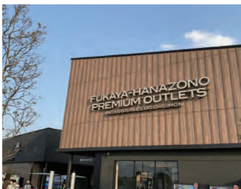
ふかや花園プレミアム・アウトレット

アウトレットの建物が総2階建てから、平屋建てに設計変更されたために、固定資産税の収入が減額となった。前回の答弁では三菱地所・サイモン(株)から令和3年7月に設計変更の報告を受けたとのことだったが、令和3年8月からアウトレットの建物の工事着工である。建築確認申請、建築確認の事前協議等があり数ヶ月から1年以上前には設計変更が行われているはずである。事前に申し入れがあったと考えるが、設計変更の打診や変更した図面を受けたのはいつか。 A 検討中の図面は交通協議等で提供を受けていたが、正式な設計業務の完了報告は令和3年7月に受けた。 Q 情報公開請求で、プロポーザルからわずか数ヶ月後である、平成27年8月27日付の平屋建ての図面を入手した。よって設計変更の打診はこ