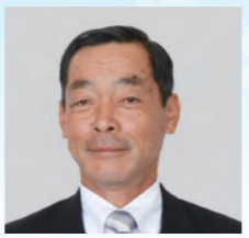
憲 由 須 八