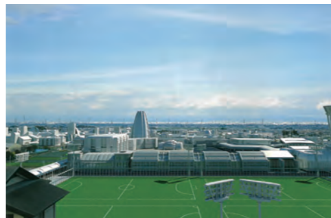
将来の岡部地域3Dイメージ図

Q 環境整備協力費(基金)を利用して岡部駅橋上駅舎化事業や、北口ロータリーまたは南口周辺の整備等を行うことは可能か。 A 橋上駅舎化事業等の進捗を見ながら、周辺環境整備の進捗状況を見据えつつ、地元の意見を伺いながら、対応すべきものと考えている。