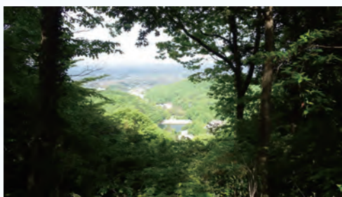
鐘撞堂山から見た霧ヶ谷津池

Q 都市計画区域での線引きの廃止や見直しを考えたことがあるか確認したい。 A 都市計画の根幹となるため、検討したことはない。引き続き、線引き制度を適正に運用していく。 Q 市街化調整区域、または事業中の土地改良区域での農地転用の仕方はどのような方法があるか。