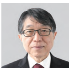
明 秀 山 出