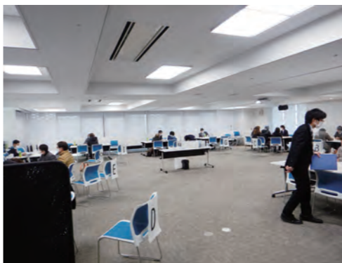
空き家相談会の様子

Q 防災の為の食糧備蓄についてー Q 食糧備蓄の助成ができないか。 A ご家庭や事業所などで備蓄いただく食糧については、自ら備えていただくものとし、日ごろから無理なく備蓄できる「ローリングストック方式」などを、毎戸に配布したハザードマップの中で啓発、また、地域の防災講座などを通じてお願いしている。