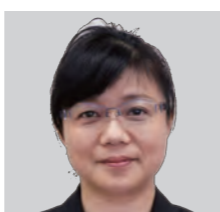
こ ま くみ こ 五 間 小 木 子