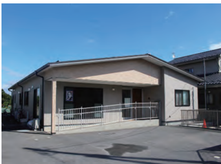
障害者就労継続支援事業所

A 令和3年度から2年間調査を行い中学生の実態を把握し、認識を深めてきたところである。今後は、調査の対象を小学校6年生にも広げる方向で準備中である。また、令和6年度から「深谷市福祉総合相談窓口（仮称）」の開設に併せてケアラーの情報も関係各課と共有し支援を行う予定である。