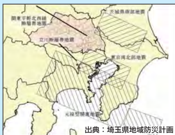
想定地震の断層位置図

本市を包含する県土全域に係る「埼玉県地域強靱化計画」との調和を保つとともに、「第2次深谷市総合計画」や「深谷市地域防災計画」等とも整合・調和を図りながら、国土強靱化に関して、本市における様々な分野の計画等の指針となる計画として位置付けています。