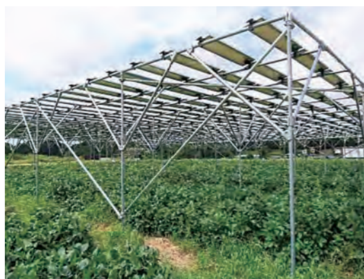
ソーラーシェアリングの例