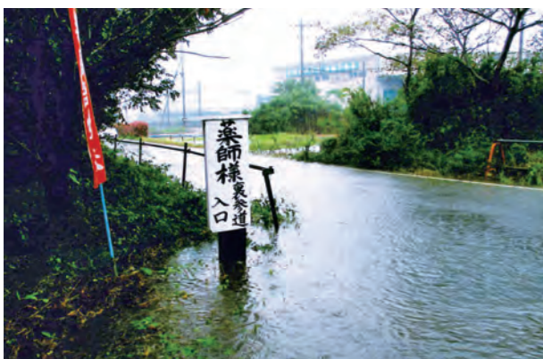
台風時の瀬山薬師堂周辺部