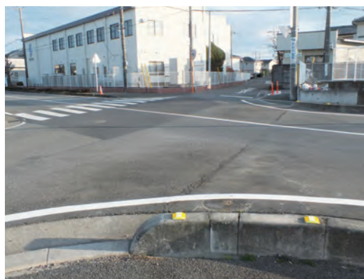
熊谷市に隣接する交差点

第3子以降の子どもの均等割を無料にすると、金額はどれくらいか。法定軽減の世帯もあるので、約