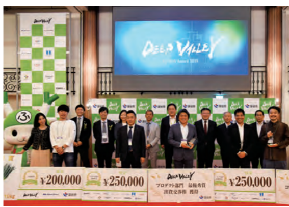
DEEP VALLEY Agritech Award2019

A 現在、本市における市営住宅は、政策空き家を除く5団地448戸で、新井住宅は76戸である。その内13戸が空き室になっている。定期的な募集を行っているが入居がふえない状況である。原因は、中心市街地から離れている、明戸小学校への登校距離が長いなどの理由が考えられる。今後も、アイデアをしぼり魅力ある市営住宅になるよう、計画的な修繕や、サービスに努める予定である。