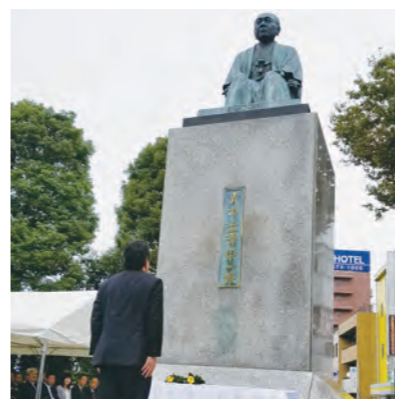
11月11日栄一翁命日、駅前銅像前での献花式

たら再度、県に確認していく。 Q 次年度から「渋沢栄一政策推進部」が新設されるが、現時点で予算請求、政策目標、数値目標等検討されているのか。部ができてからそれらの業務が始まるのか。 A 現体制において検討を進めており、4月からスムーズに事業を執行できるように準備している。