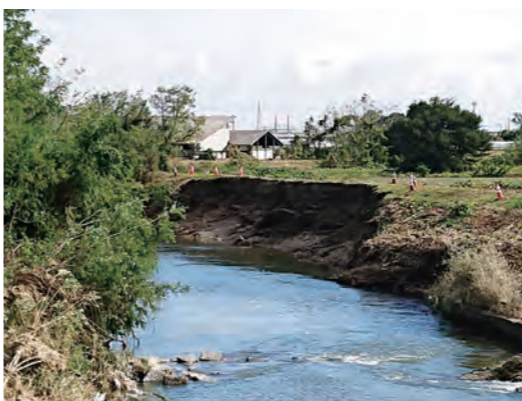
台風通過後の志戸川