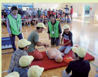
学校応援団の支援にて心肺蘇生体験補助

本校は、「学校・家庭・地域が一体となって子どもたちを育てます!」を共有目標に、学校応援団との連携を図り、教育活動を進めています。 具体的には、学習支援ボランティア(読み聞かせサークル・昔あそび・ミニボランティア、かるた大会の審判)、環境整備ボランティア(図書室整備・花の植え替え)、安心安全ボランティア(登下校)など地域、保護者の皆様にお世話になっております。 特に、学校運営協議会で熟議され実現してからの今年で3回目を迎えた「地域