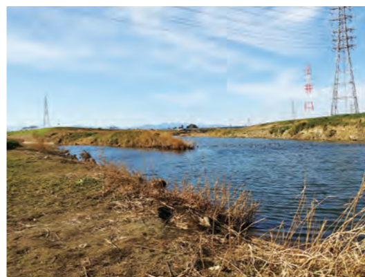
小山川と合流する唐沢川

防災組織の活用は出来たのか。 自主防災会の会長や、自治会長へ、個別に電話連絡をした。今後地