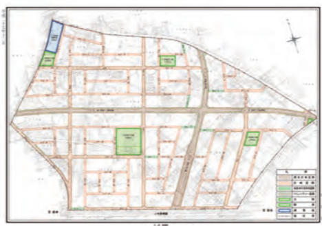
深谷都市計画事業 国済寺土地区画整理事業設計図

A 雨水排水対策のため、ポンプ3台を設置し、時間当たり150ミリの排水能力を設定している。先日の台風19号の降雨量でも、問題ない。仮に、想定外の雨量でも、万一の冠水に備え、アンダーパス内に冠水センサーやバルーン式自動遮断器、監視カメラ、停電時の自家発電設備等設置し、より安全性を確保していく。