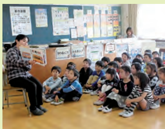
読み聞かせサークルによる読み聞かせ

本校は、「学校・家庭・地域が一体となって子どもたちを育てます!」を共有目標に、学校応援団との連携を図り、教育活動を進めています。 具体的には、学習支援ボランティア(読み聞かせサークル・昔あそび・ミニボランティア、かるた大会の審判)、環境整備ボランティア(図書室整備・花の植え替え)、安心安全ボランティア(登下校)など地域、保護者の皆様にお世話になっております。 特に、学校運営協議会で熟議され実現してからの今年で3回目を迎えた「地域