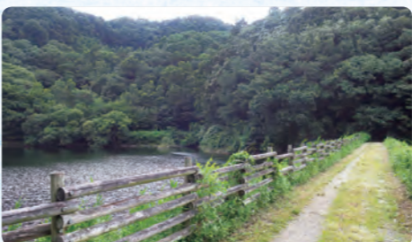
霧ヶ谷津池の木柵

A 埼玉県信用組合協会のからの寄附であり、難病や障害を持つ子供と家族の支援や子供と家族の健全育成のために使って欲しいとの寄附目的である。