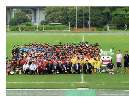
深谷ラグビーフェスティバルにおいて

Q ラグビーワールドカップ2019の教育プログラムの取組は。 A 深谷市はラグビーワールドカップ