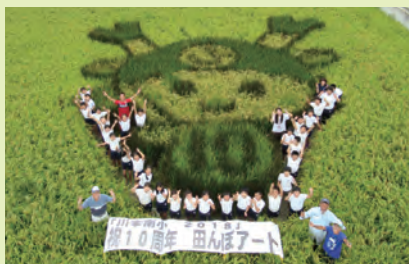
H30年度・田んぼアート

本校の学校応援団の組織は、二名の学校応援コーディネーターを中心として、「学習活動」「安心安全」「環境整備」「体験活動」「学校美化」の五つの支援部から成り立っています。それぞれに部長さんがおり、学習活動支援部は学年ごとの支援班に分かれ、中心となる班長さんが置かれています。毎年五年生が取り組む「田んぼアート」は、本校の特色の一つです。学校応援団の方々のご理解と協力の下「初ふり」から始まり「田植え」「写真撮影」「稲刈り」「収穫祭」と一連の流れ