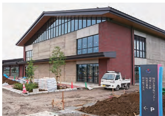
建設中の岡部公民館

アウトレットモール開業後は、市内外から約650万人の来訪者を見込んでいる。市は来訪者がこつした施設を訪れることにとまらず、市内を回遊し、地域経済の発展に資するよう仕組みづくりを検討している。北西部地区は、道の駅おかべをはじめ、広域的な集客施設が立地し、寄居PAのスマートインターチェンジの開通や榛沢通り線の整備が予定されるなど、交通網の整備が進められ地域に新たな人の流れを見込んでいる。加えて歴史・文化的にも貴重な渋沢栄一翁ゆかりの関連施設が論語の里として整備されている。また、本年10月には新岡部公民館がオープンする予定であり、今後地域の皆様の活動拠点、さらにはまちづくりの拠点として様々な活動に利用していただくとともに、地域のシンボルとなるものと期待されている。