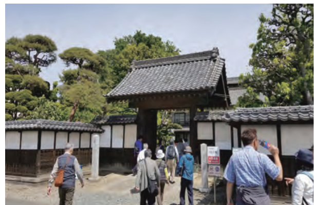
にぎわいをみせる栄一翁関連施設

Q 今回の件は「オール深谷」で臨まなければならぬと思う。今後の庁内体制はどうするのか。 A これから必要な調整を行い、来年度は専任組織を設置し、市の発展に向けて事業展開する予定である。