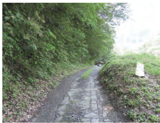
鐘撞堂山への進入路