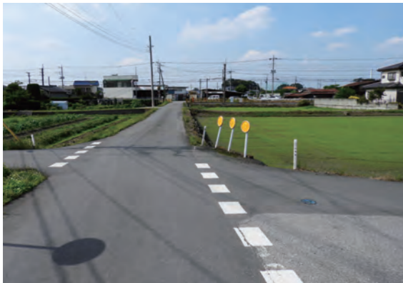
市道幹 104 号線

A 当該工場では、排水処理施設の不具合により汚水が流出することがあり、平成23年度から県の北部環境管理事務所とともに指導を行ってきた。本年5月にも地元自治会長から相談を受け、立入調査を行ったところであり、引き続き、水質測定結果により指導を行っていく予定である。