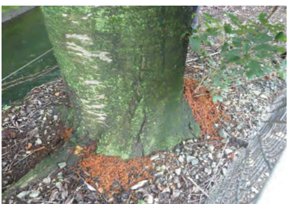
見かけたら環境課へ