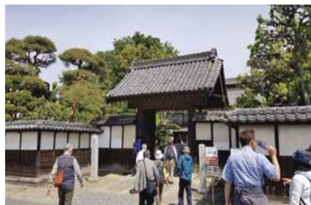
にぎわいをみせる栄一翁関連施設

Q 今回の件は「オール深谷」で臨まなければならぬと思う。今後の庁内体制はどうするのか。 A これから必要な調整を行い、来年度は専任組織を設置し、市の発展に向けて事業展開する予定である。