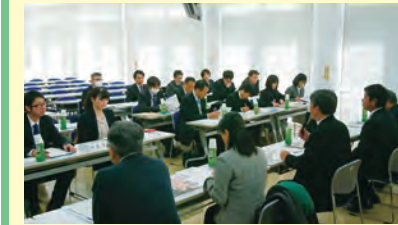
30(火) 議員全員協議会