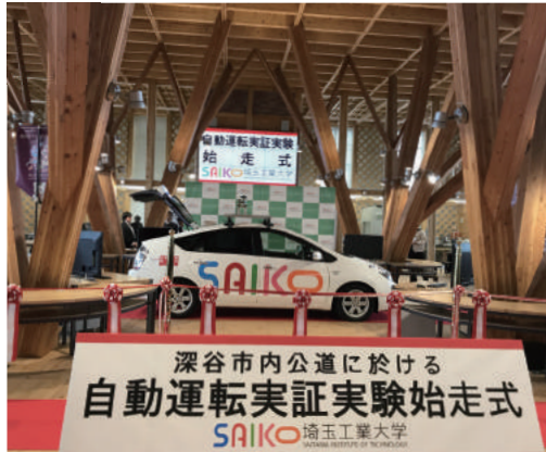
公道実証実験車両(トヨタ プリウス改造車)

実験車両は、エンジン始動・停止・シフトの切替、操舵、制動、駆動、その他周辺機器を、コンピュータを介して操作することができます。実証実験では、車体の内部や上部に、実験内容に応じた様々な装置を法律の範囲内で取り付けて自動運転を行います。