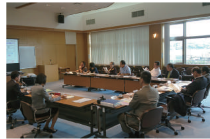
10.4~10.6 由利本庄市教育委員会より説明を受ける

れている。条例概要は「健康づくり」「賑わいづくり」「人づくり」を基本目標に掲げ、スポーツに関する事業を担当部局に限定せず、市が部局を横断して取り組むことや、市や市議会が連携してスポーツ振興によるまちづくりを進めることを盛り込んでいる。 その他の視察先 学力向上の取り組みについて 秋田県由利本庄市 他