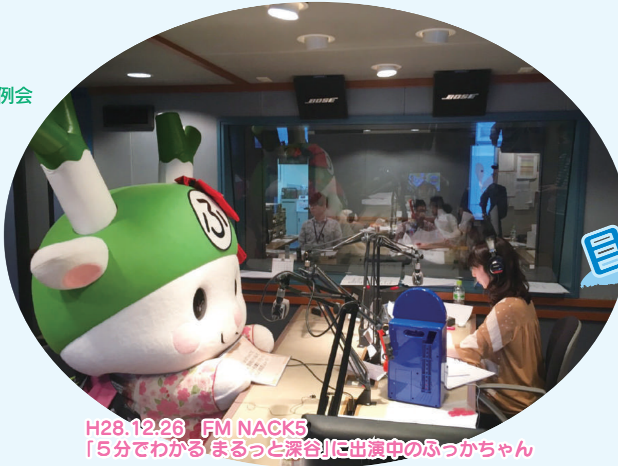
H28.12.26 FM NACK5 「5分でわかる まるっと深谷」に出演中のふっかちゃん

平成29年度当初予算は、459億5,249万円であり、前年度と比べて約21億7,613万円(4.5%)減額となりましたが、これは、防災行政無線の更新終了、消防通信指令台入替完了などのためです。主な施策を紹介します。