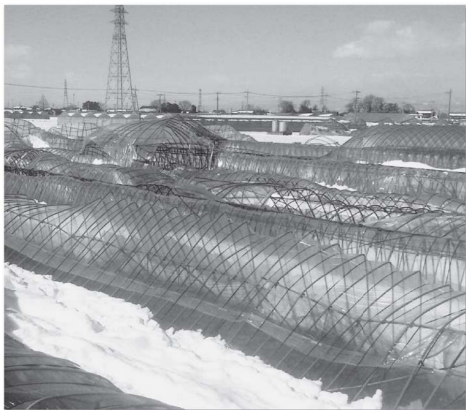
ビニールハウス再建前