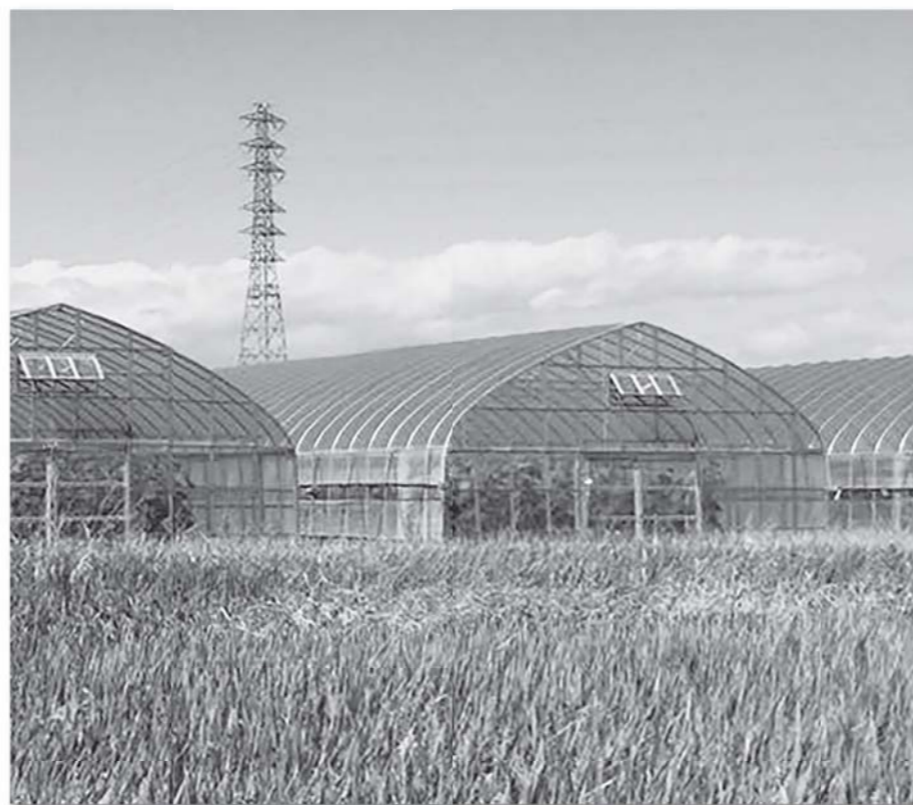
ビニールハウス再建後