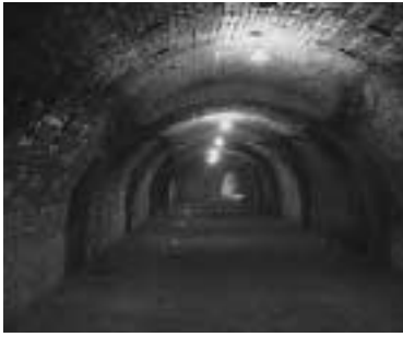
ホフマン輪窯6号窯

答 旧渋沢邸「中の家」の見学者が年間1万2千名を超える状況や、旧日本煉瓦施設の特別公開における盛況を見ると、市内外の関心の高さを理解できる。道路案内標識については、現在のものも含めて全体を見直していく。外国からの見学者も増加していることから、案内・展示解説・パンフレットなど、その外国語表記については研究していく。今後はそれぞれの文化財を結んだゾーニングについて研究し、点から線の整備へとつなげていけるように取り組んでいきたい。