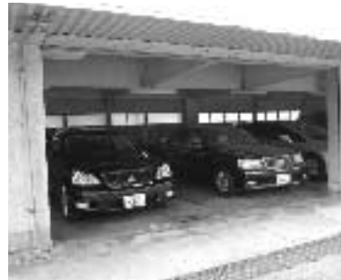
市長車・廃止した副市長車

答 8月に一般競争入札にて売却予定である公用車(2台)は使用していない。市長車は、市外の公務にのみ、市長・副市長・教育長が共用で使用している。市内の公務は、一般公用車を使用している。