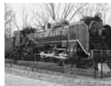
仙元山公園のSL(蒸気機関車)

問 故障の原因と復旧に至る経緯について聞きたい。 答 8月30日に旧深谷市内全域で放送が流れていないことを確認し、至急修理を依頼、9月4日から運用を再開しました。8日午後10時57分頃、昼のチャイム放送が突然流れず、翌日保守業者による点検を実施、故障の原因は不明でした。翌々日機器メーカーによる検査を実施、プログラム制御の時計回路部分に不具合を発見、部品を交換しましたが、機器の不安定な状況が続きました。9月末日に至るも運用再開ができず、新しい機器の設置を急いだ方がよいとの判断に達し、11月中旬を目途に設置することとし放送を中止しました。10月に入り夕方方のチャイム放送が流れないとの苦情が殺到、9日