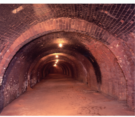
ホフマン輪窯6号窯

Q 5千円を7千円に引き上げても効果がなと思う。医療の実態を丁寧に説明し、理解を戴くべきと思うが、対応について伺う。