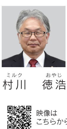
おやし 浩 映像はこちらから

Q プロジェクトの収支が、20年間で87・6億円から30年間で94・8億円と下方修正された要因は。