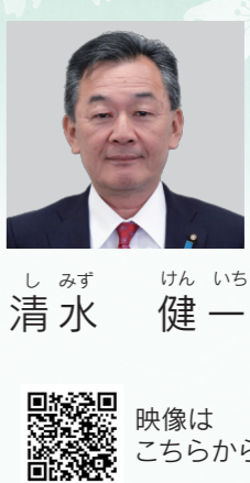
けんいち 一 健 映像はこちらから

Q 今でも回復期病床が不足している中、42床を急性期病床に転換する病院があるようだが要因を伺う。