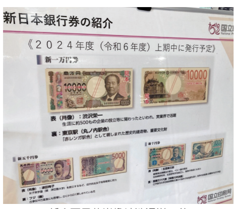
新一万円札肖像は深沢栄一翁