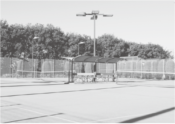
川本天神グラウンドテニスコート

答 既存の文化財保存事業の後継者育成事業補助金等の適用は創設後、日も浅く難しい。市では今後も、平成24年度に開催した事業のように重忠太鼓を図っていききたい。