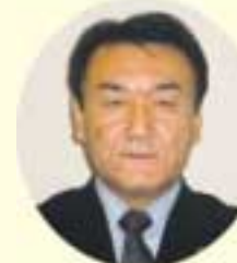
35 三田部恒明 公明党