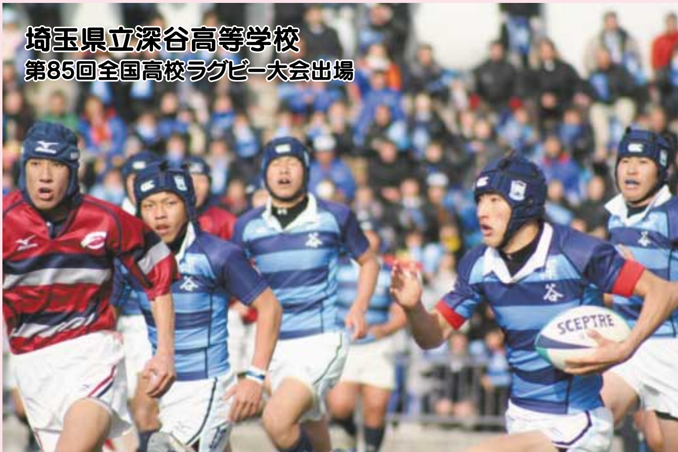
花園ラグビー場において