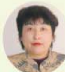
37 野澤喜代子 公明党