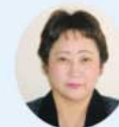
34 佐藤美智子 公明党