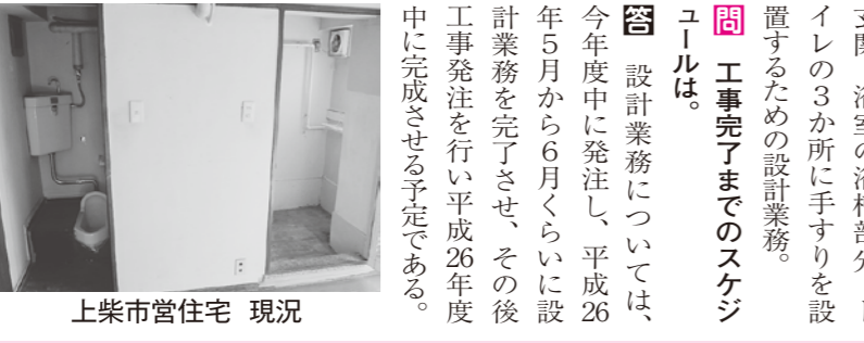
上柴市営住宅 現況

旧花園町から土地開発 問 旧花園町から土地開発公社が引き継いだものを、市が取得するのか。 答 合併で引き継いだ時に土地開発基金で該当の土地を公園用地として所有して