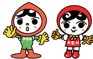
人権イメージキャラクター 人KENまもる君・人KENあゆみちゃん

【相談例：いじめ、差別、虐待、プライバシーの侵害、ハラスメント、インターネット上の誹謗中傷など】