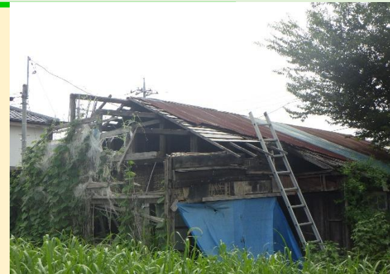
※不良住宅のイメージ

昭和56年5月31日以前に建築され、 不良住宅 に判定された空き家 ※ 不良住宅の判定は、事前調査に基づき、市で判定を行います。