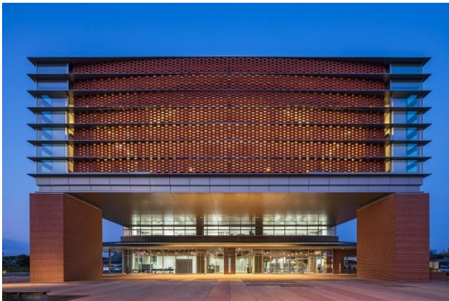
夜の市役所の様子