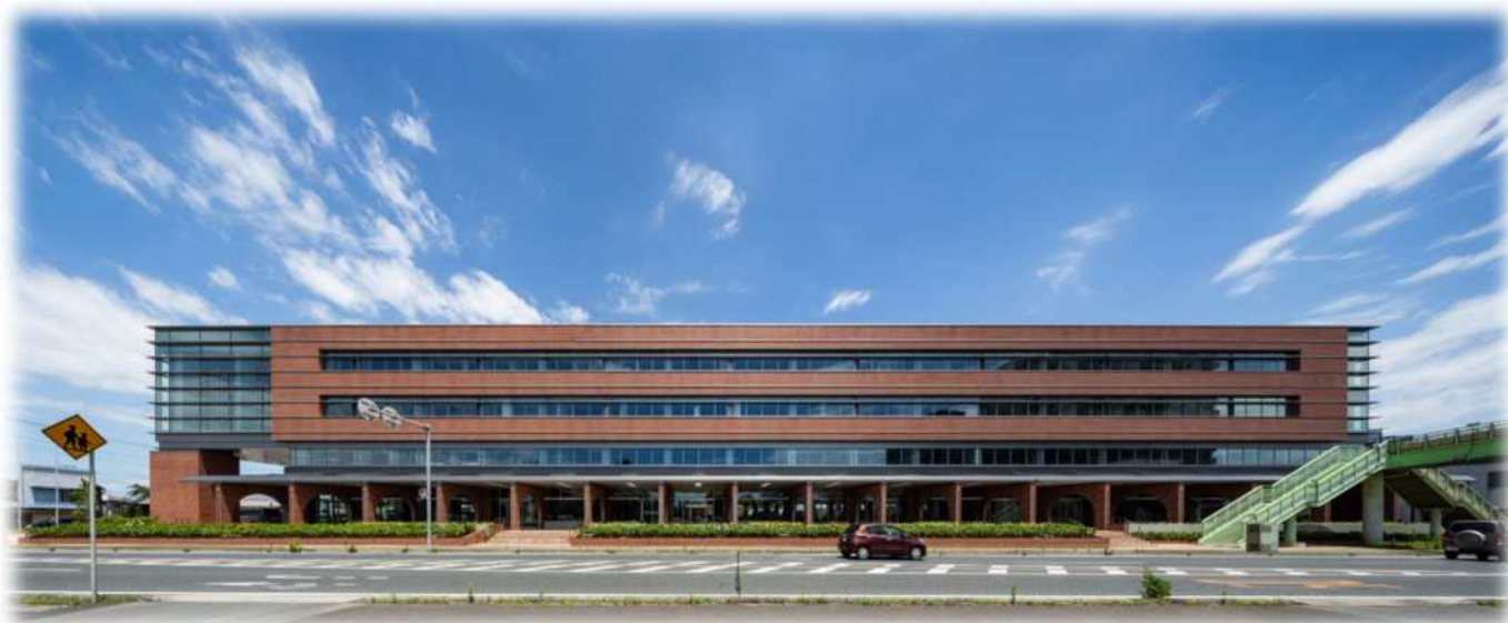
深谷市役所本庁舎（令和2年7月完成）