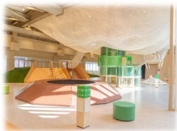
深谷市こども館（令和8年4月完成）