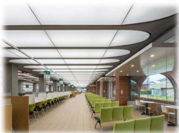
深谷市役所本庁舎1階の様子