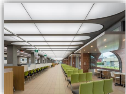
市役所本庁舎1階の様子

新規採用職員には、インストラクターとして先輩職員による伴走型の育成制度があります。