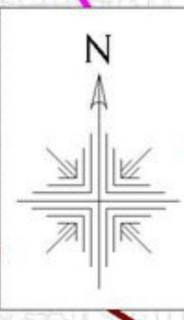
埼玉県 利根川水系小山川流域 洪水浸水想定区域図・水害リスク情報図（想定最大規模）

1 説明文 (1) この図は、利根川水系小山川流域の県管理区間について想定し得る最大規模の降雨による洪水浸水想定区域、浸水した場合に想定される水深を表示した図面です。 (2) この図は、作成時点の利根川水系小山川流域河川の河道及び洪水調節施設の整備状況を勘案して、想定し得る最大規模の降雨に伴う洪水により河川が氾濫した場合の浸水の状況をシミュレーションにより予測したものです。 (3) なお、各シミュレーションの実績にあたっては、支川の（決壊による）氾濫、シミュレーションの前提となる降雨を超える規模の降雨による氾濫及び内水による氾濫等を考慮していませんので、この洪水浸水想定区域に指定されていない区域においても浸水が発生する場合や、想定される水深が実際の浸水深と異なる場合があります。