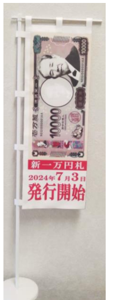
完成イメージ (市販のミニのぼり旗立てを使用)