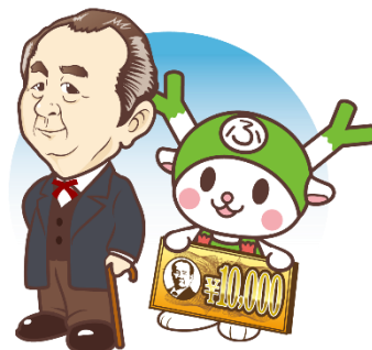
郷土の偉人 渋沢栄一 深谷市イメージキャラクター ふっかちゃん