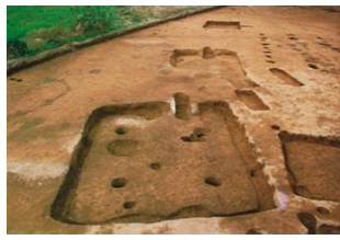
並んでいる竪穴建物跡