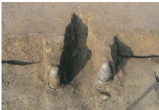
竪穴建物内のカマド

この集落の調査では、多量の遺物が出土しています。人々の居住域である集落域は、生活に伴う土器などの遺物が多いものと考えられます。大規模な建物が計画的に建ち並ぶ官衙域(役所の範囲)は掃き清められているために遺物が少ないため、集落域から出土する多量の遺物は、郡役所を考える上でも重要な手がかりになります。