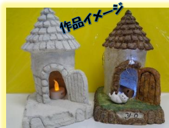
おおよそ高さ23センチメートル 花園公民館窓口に見本があります

◇申込み：令和5年1月10日(火)から花園公民館窓口または電話でお申込みください。 (平日午前9時から午後5時まで) ☎花園公民館：584-2184 ※新型コロナウイルス感染状況により、内容を変更または中止になることがあります。