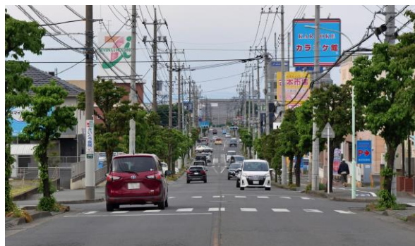
フリモント通り（2022/5/14撮影） サンフランシスコのケーブルカーの坂に似ている気も？

現在のようにインターネットもない当時は、海外はずっと遠く、国際交流、異文化交流は稀有な機会だったことでしょう。