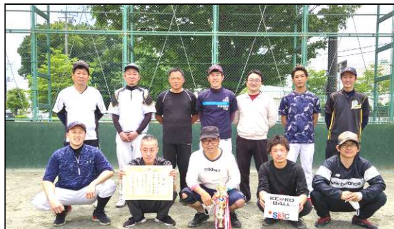
準優勝 榎引チーム