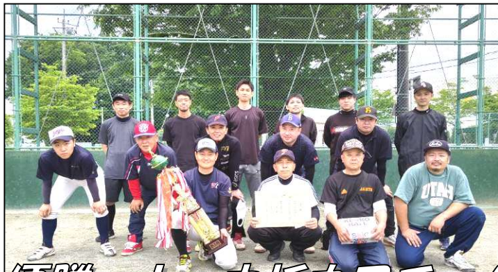
優勝 上・中折之口チーム