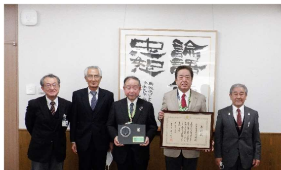
2月14日(火) 深谷市長に受賞を報告

今年度は全国で72館が選ばれましたが、明戸公民館は、明戸中学校と合同開催している「市民体育祭」を始めとする地域の皆様と一体となった取り組みが評価されたものです。