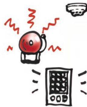
自動火災報知設備