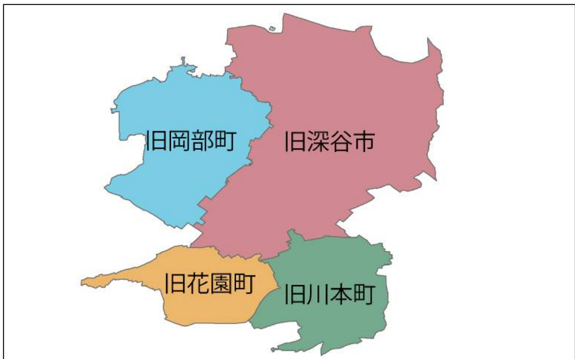
図 1 合併前の深谷市

本市の緑の基本計画の策定においては、旧市町が描いていた緑の方向性を踏まえながら、深谷市の良好な緑を次代に向けて保全、育成、活用するために、また、新市としての環境、レクリエーション、防災、景観上の特性を活かし、深谷市の緑環境についての将来像と、それを実現するための施策等を定めることを目的とします。