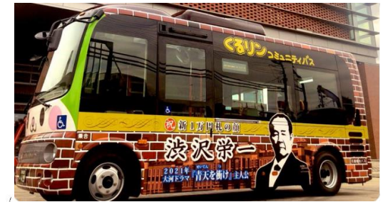
今回運行ルートを変更する北部シャトル便