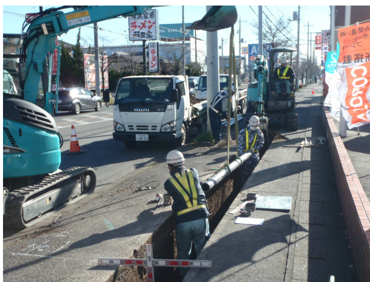
配水管工事 施工状況写真