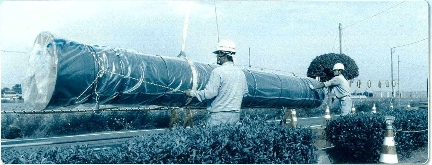
〈 水道工事風景 口径φ700mm 〉