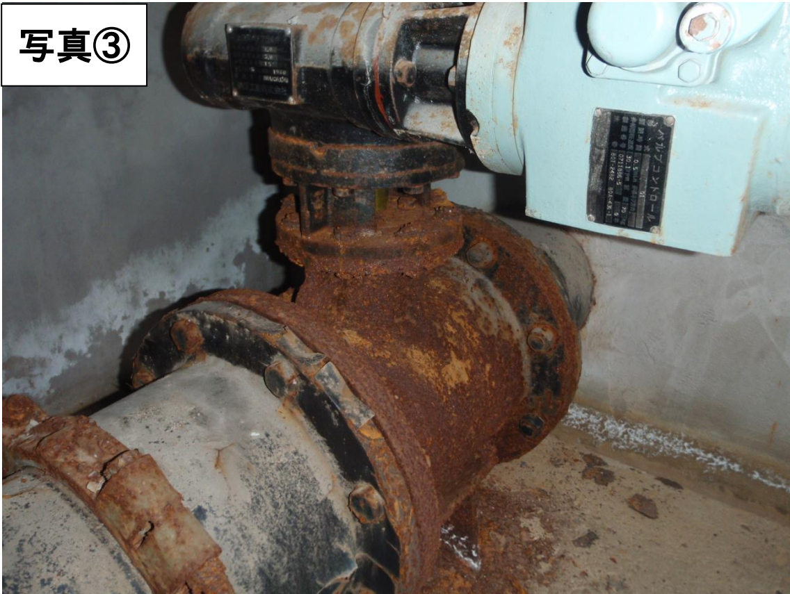
除鉄・徐マンガン装置 腐食・補強状況