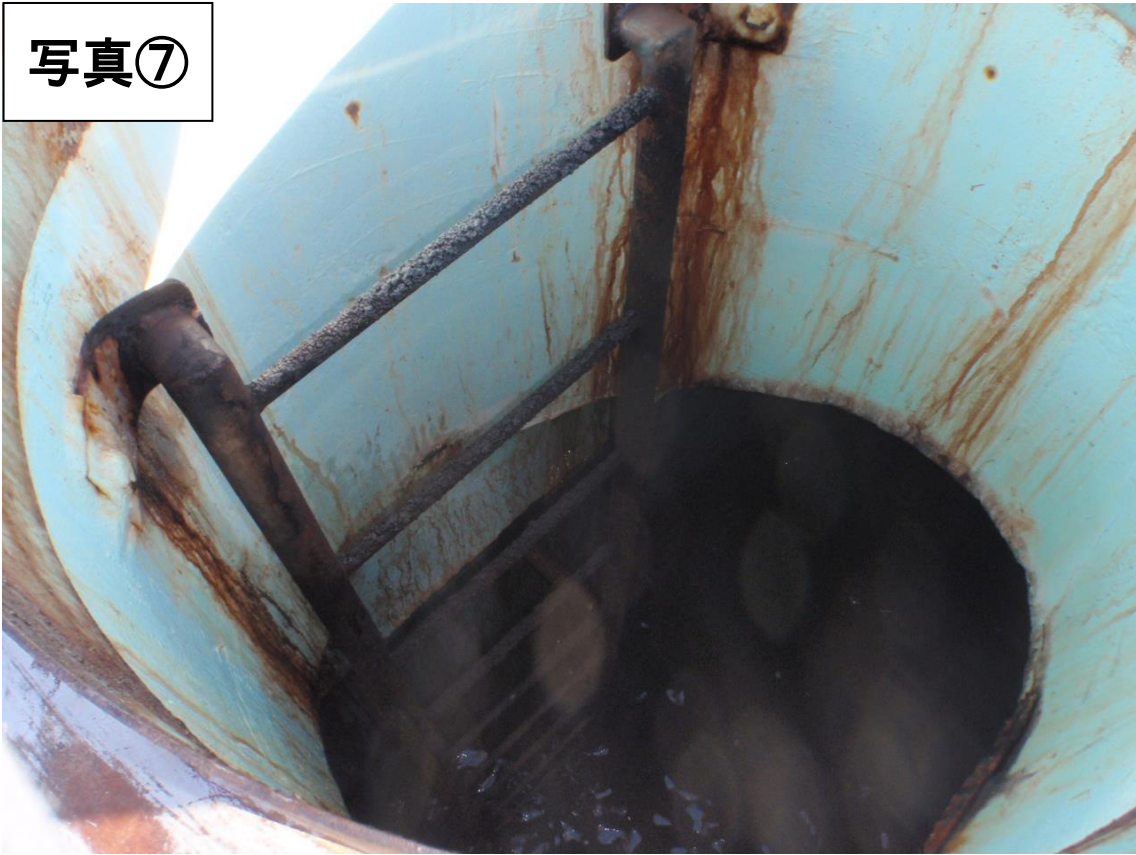
管理棟 配水ポンプ室