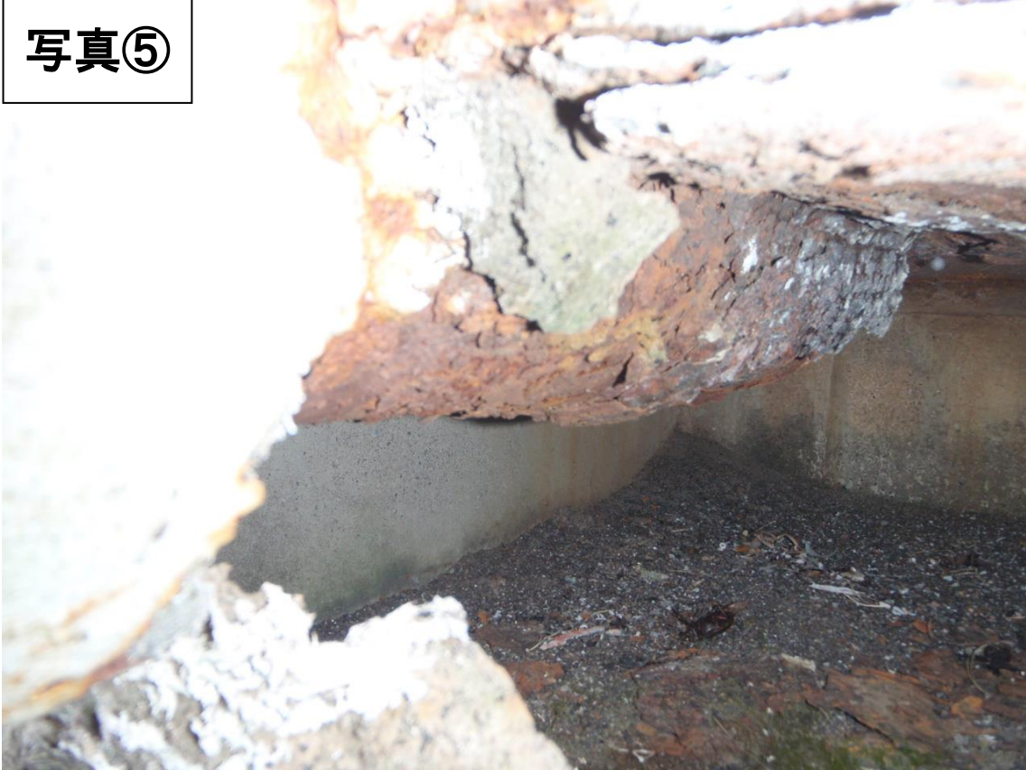
No. 1 配水池 上部