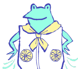
ファン付きウェア、 ネッククーラー