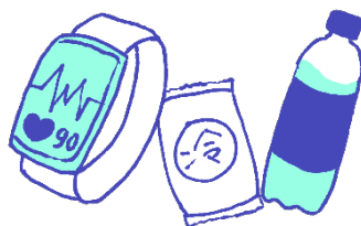
ウェアラブル端末、 応急セット