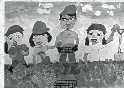
たくさんとれたよ ジャがいもほり