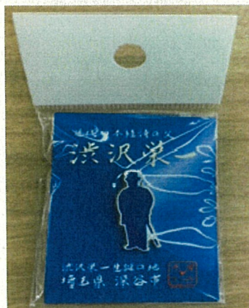
(シルエット) 色：ブルー