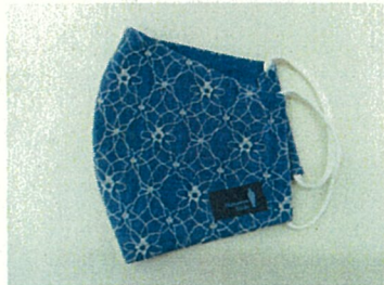
(青淵レースマスク)