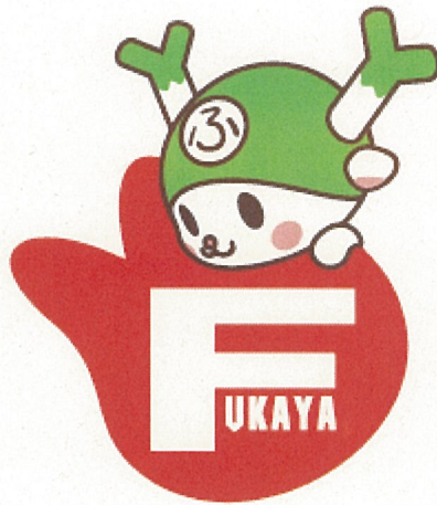
市の花「チューリップ」とふっかちゃんのワンポイントデザイン

軽装運動期間中の毎週金曜日は『ふっかちゃんCOOL BIZ DAY』、略して『ふっか ビズ BIZ』とし、作成したふっかちゃんポロシャツ等を職員が着用して、ふっかちゃんの応援及びPRを行います。