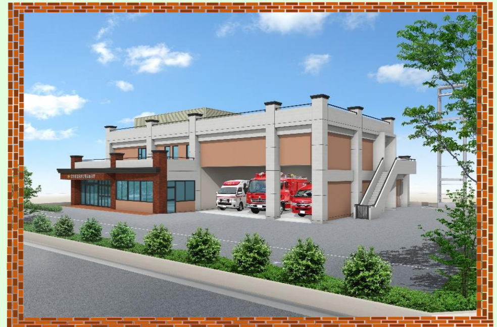
消防分署のイメージ