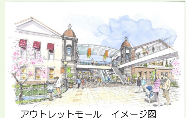
アウトレットモール イメージ図