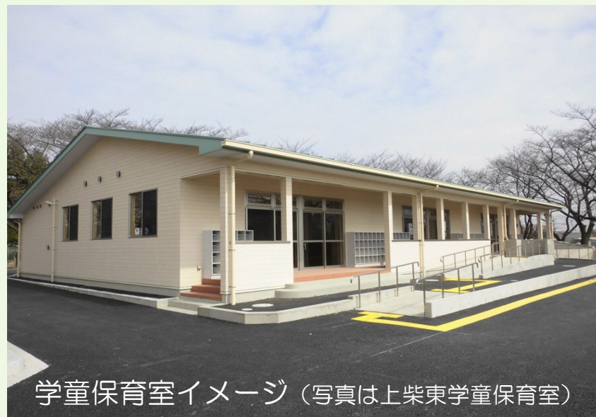
学童保育室イメージ (写真は上柴東学童保育室)