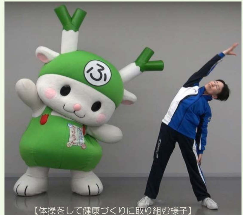
【体操をして健康づくりに取り組む様子】