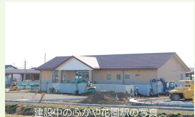
建設中のふかや花園駅の写真