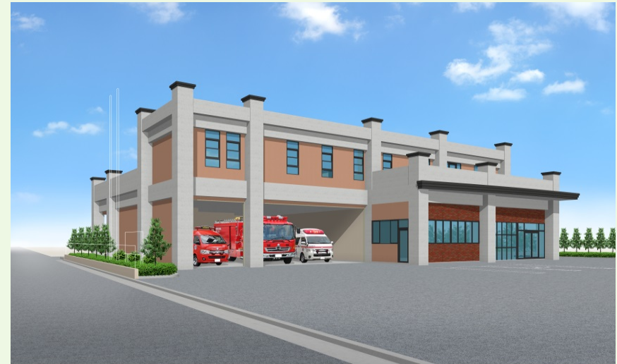
基本設計に基づく消防分署のイメージ