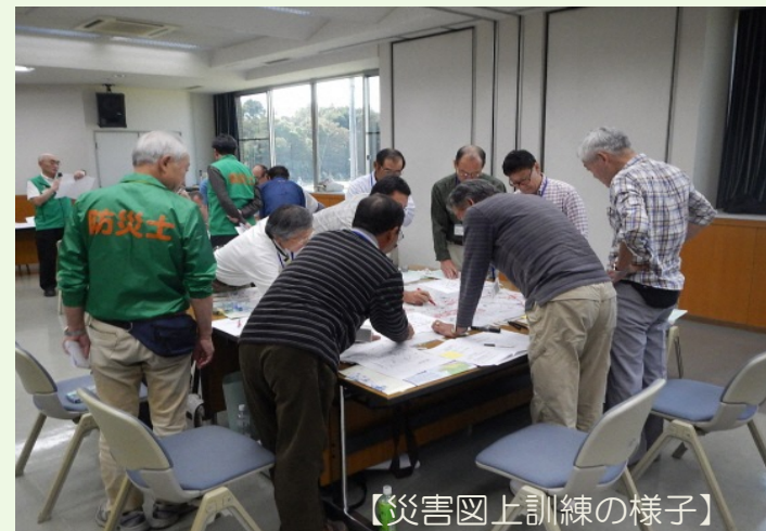
【災害図上訓練の様子】