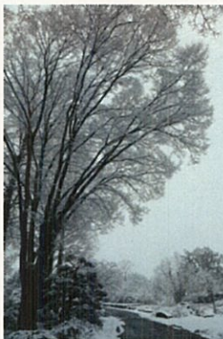
作品 No.30 「雪の王国へようこそ」