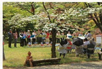
作品 No.18 「一人聴き入る」