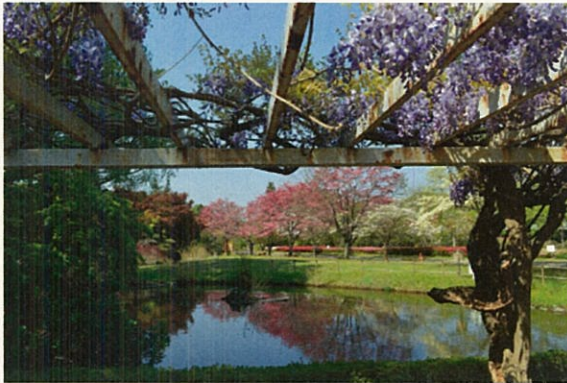
作品 No.6 「競演」