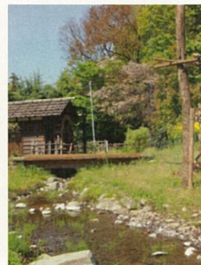
作品 No.19 「春の小川」