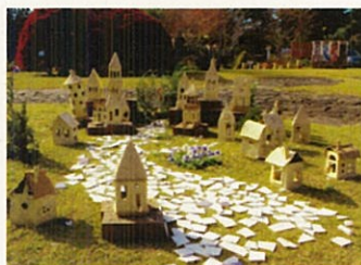
作品 No.51 「ふかや緑のおとぎの国」