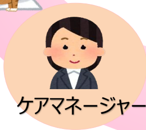
ケアマネージャー

講演会や研修会、ホームページなど で、在宅医療に関する様々な情報 を提供しています