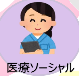
医療ソーシャル ワーカー(MSW)