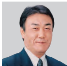
あき たま べ つねあき