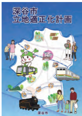
深谷市立地適正化計画

Q 学力向上プロジェクトの詳細は。 A 「思考力・判断力・表現力」を養う問題を、各学校で毎月実施し、児童生徒に繰り返し取り組ませ、児童生徒の学びを支援している。