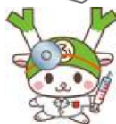
心疾患になる危険性

危険因子0の人が心疾患になる危険性を1とすると、3~4つの人は危険性が約 30倍 になります。