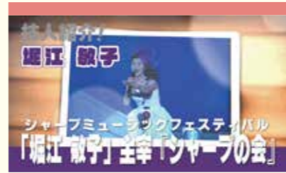
音楽（歌・カラオケ） 堀江 敏子

日本歌謡連盟師範・神演会歌謡道場特別師範。21 歳のときに声を失う。以降 18 年間、歌いたいという夢を追い続け、平成 6 年以降、数々の賞を受賞。歌のレッスンのほか、江南の『ピビア』で毎年カラオケ教室発表会を開催。講演、講師、イベントの出演依頼ができる。