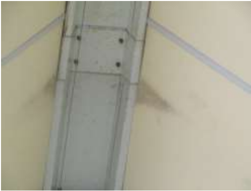
No.1 天井建材からの雨漏り