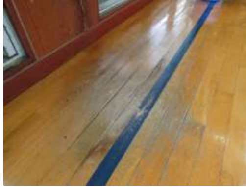
No.2 アリーナ床面の漏水による腐食