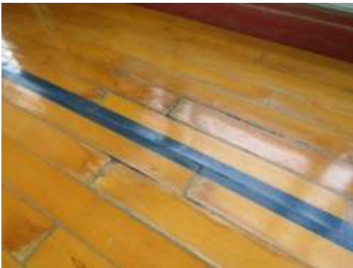
No.3 アリーナ床面の剥離