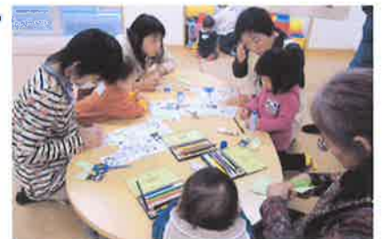
▲指にんぎょうづくりの様子

1月18日(木)読み聞かせと人気アニメのキャラクターなどの形をした指にんぎょうをお母さんと一緒に作りました。できあがった指にんぎょうを使いながら、お母さんやお友だちと話をしたり、歌あそびをしたり楽しんでいました。