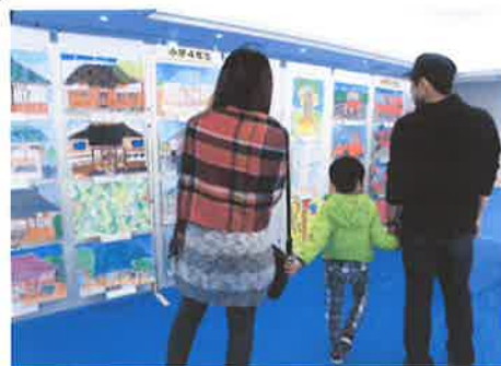
※写真は昨年の様子です