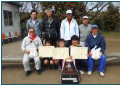
優勝 新井西部分館

3月6日(日)に三世代交流グラウンド・ゴルフ大会が、浄化センター内運動公園で行なわれました。天候にも恵まれ、三世代の交流も深まり、とても活気のあるグラウンド・ゴルフ大会となりました。婦人会の皆さんによる豚汁も美味しくいただきながら楽しい時間を過ごしました。